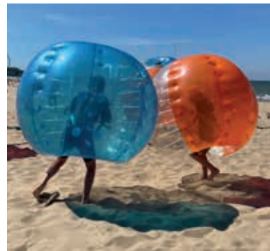
BEACH BUBBLE VOETBAL